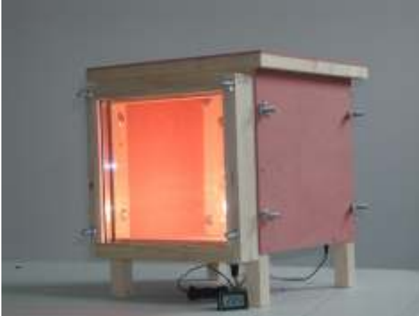
1. La casetta