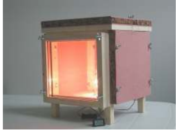
2. La casetta coibentata

La “casetta del sole” è un semplice modello didattico sperimentale, che permette di “toccare con mano” l’efficacia della coibentazione (isolamento) del “tetto” e delle “pareti” (opache e vetrate) e anche l’efficacia delle lampade fluorescenti a risparmio energetico.